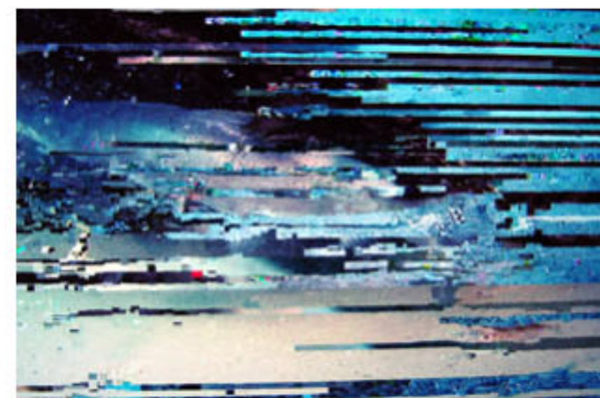
ブロックノイズが発生